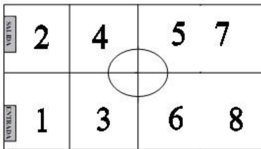
GRÁFICO CON LA NUMERACIÓN DE LOS CAMPOS